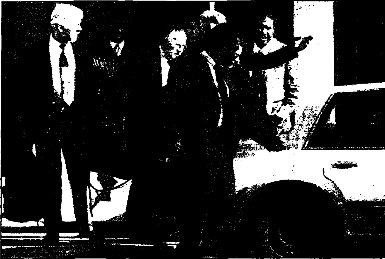
خبير الصواريخ الروسي نيكيتا سميدوفيتش لدى توجهه مع وفد اللجنة الدولية الذي يرأسه إلى وزارة الخارجية العراقية أمس